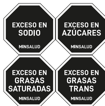
b. Opción 2